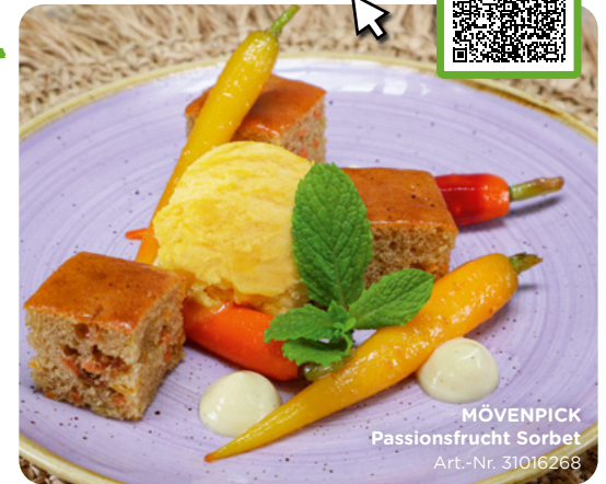
MÖVENPICK Passionsfrucht Sorbet Art.-Nr. 31016268

Möhr than Ice Cream: Saftige Kuchen-Minis Carrot Cake mit fruchtigem MÖVENPICK Passionsfrucht Sorbet und Vanillesauce – natürlich alles vegan!