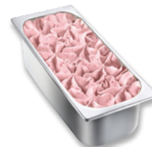
AGDC Fragola Art.-Nr. 31015845