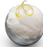
MÖV Citronen Sorbet Art.-Nr. 31016327