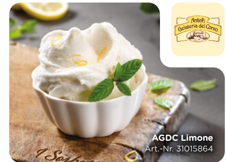
AGDC Limone Art.-Nr. 31015864

Tradition und Trend: Die veganen Sorten von ANTICA GELATERIA DEL CORSO überzeugen durch italienisches Eishandwerk und ausgewählte Zutaten.