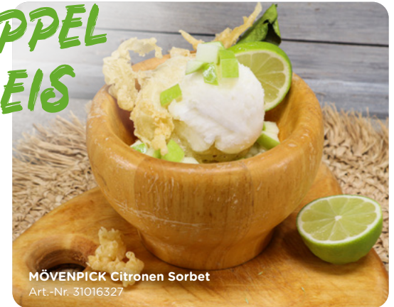
MÖVENPICK Citronen Sorbet Art.-Nr. 31016327

Ziemlich frisch hier: Grüne Apfelstückchen mit Apfelkuchlein im Tempurateig treffen auf erfrischendes MÖVENPICK Citronen Sorbet!