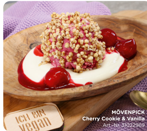
MÖVENPICK Cherry Cookie & Vanilla Art.-Nr. 31022969