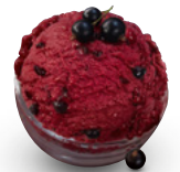
MÖV Cassis Sorbet Art.-Nr. 31016352

Tradition und Trend: Die veganen Sorten von ANTICA GELATERIA DEL CORSO überzeugen durch italienisches Eishandwerk und ausgewählte Zutaten.