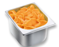
AGDC Melone Art.-Nr. 31018123