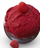
MÖV Himbeer Sorbet Art.-Nr. 31016256

Unsere Fruchtsorbets sind nicht nur fruchtig, sondern auch vegan! Da passt unser neues MÖVENPICK Cherry Cookie & Vanilla ideal dazu: ein herrlich frischer Swirl aus Sauerkirschsorbet, Cookies und Vanilleeis – und alles vegan!