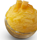
MÖV Passionsfrucht Sorbet Art.-Nr. 31016268