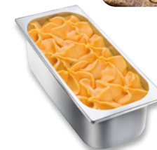
AGDC Mango Art.-Nr. 31019662